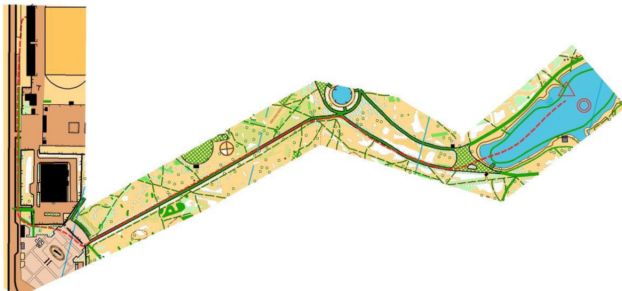
Схема движения на старт